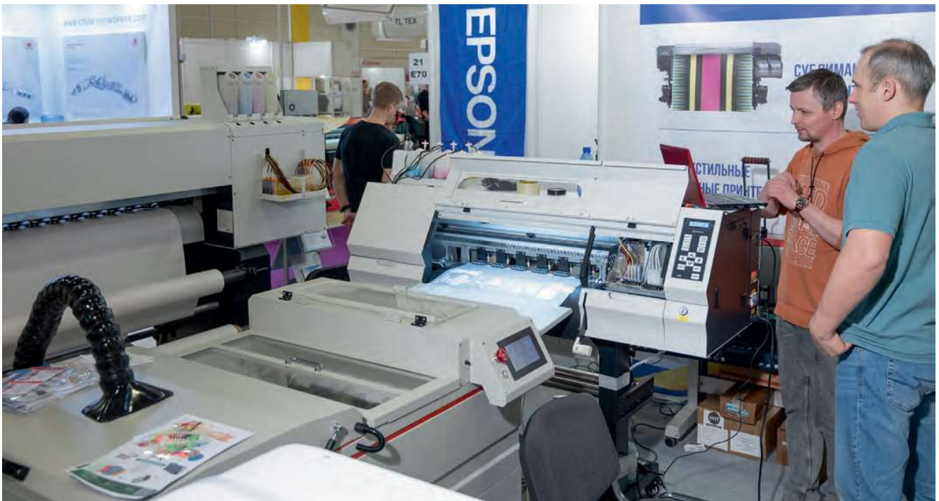
На стенде компании «Алларт Сервис» были представлены сублимационная и прямая печать по текстилю, а также DTG- и DTF-принтеры