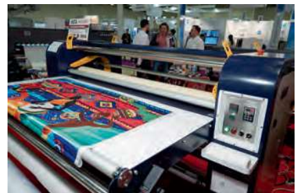
На стендах компаний «Смарт-Т» и «КОВЧЕГ», входящих в один холдинг, был представлен самый широкий спектр оборудования на выставке