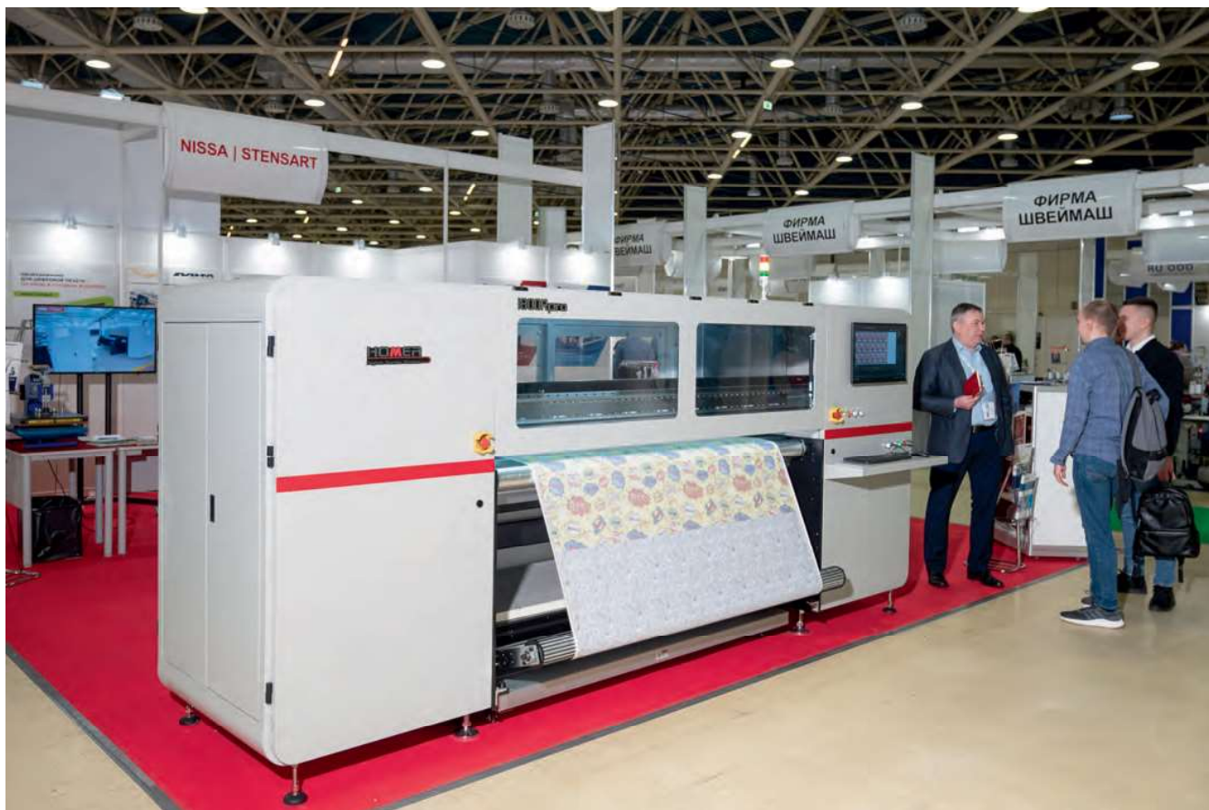
Промышленный принтер HOMER